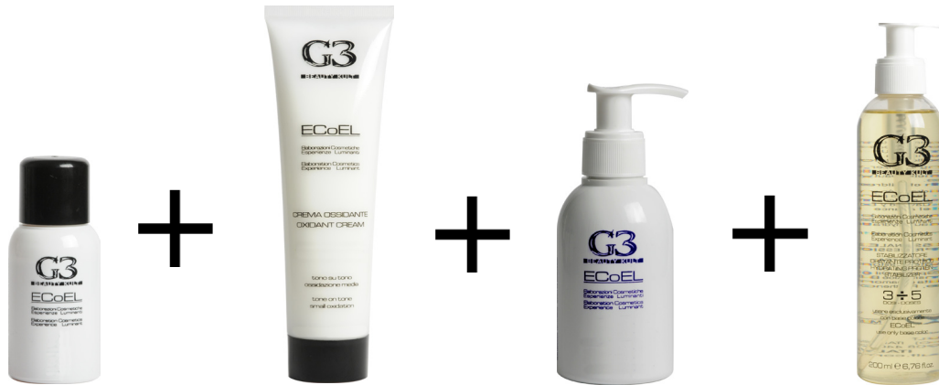
50 ml di colore 5. CASTANO CHIARO 50 ml color base

Esempio pratico per realizzare un 5.6 "castano chiaro rosso": Example 5.6 "Light brown Red":