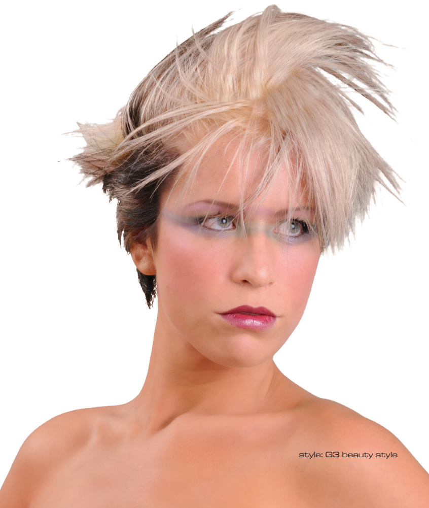
style: G3 beauty style