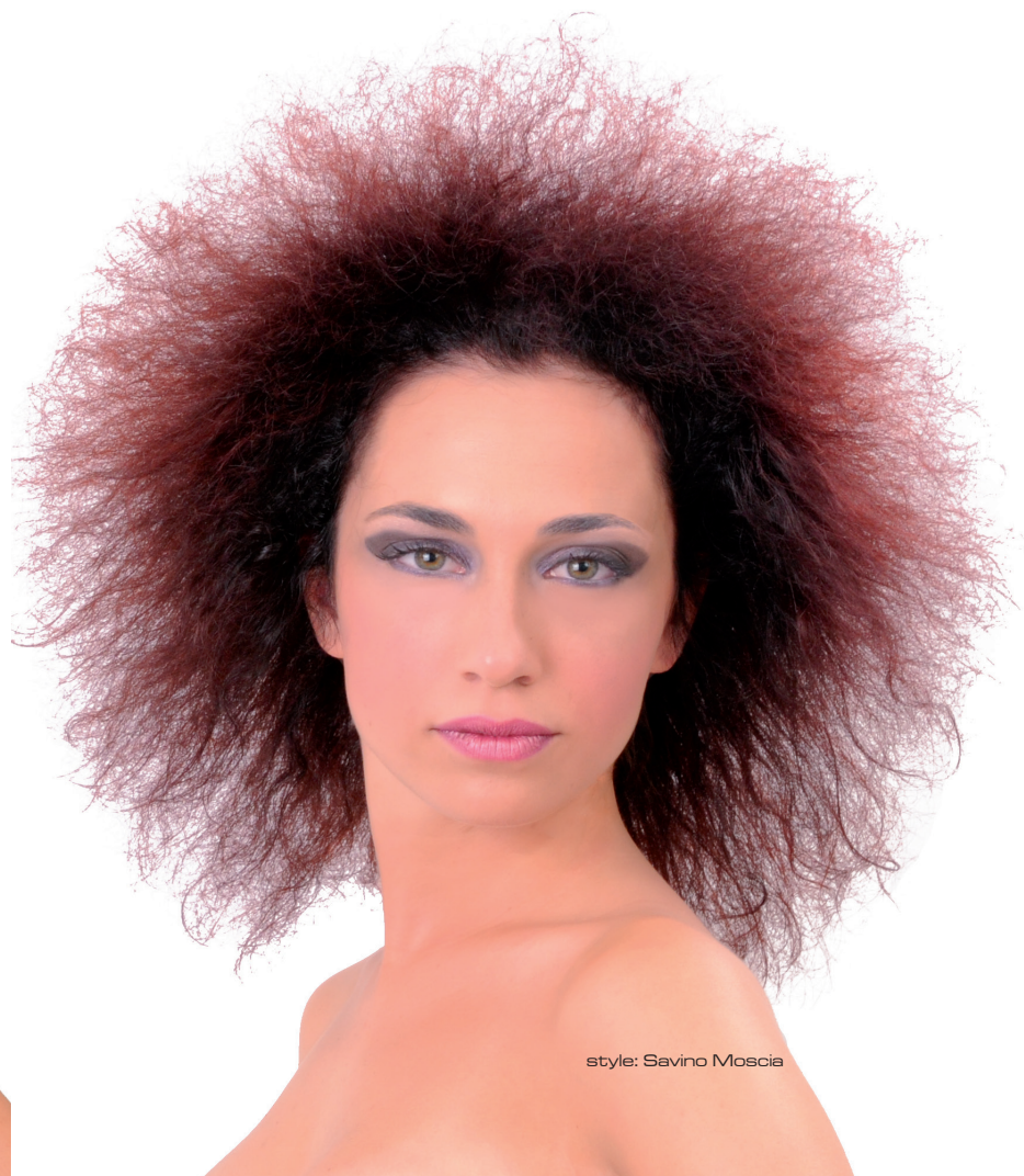
style: Savino Moscia